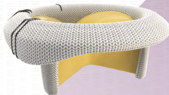
MITRIS RESILIA mitral valve

*No clinical data are available that evaluate the long-term impact of RESILIA tissue in patients. Additional clinical data for up to 10 years of follow-up are being collected to monitor the long-term safety and performance of RESILIA tissue.