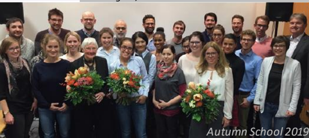
Autumn School 2019